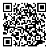
果陀劇 場粉絲 頁