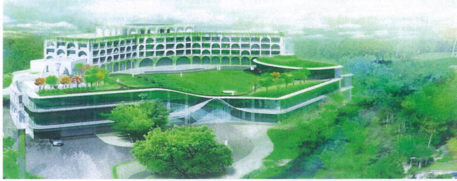
滬尾藝文休閒園區 FAB GREEN VILLAGE

淡水素為藝文人士所喜愛，歷來藝術家創作作品不乏以淡水風情為表現體裁，為豐富藝術人文創作，提升生活環境美感教育，促進親子和諧關係，特舉辦「滬尾之美·淡水之最」寫生比賽，藉由鼓勵學生寫生創作，展出優秀得獎作品，厚植淡水滬尾藝文休閒園區的人文藝術創作，發展北臺灣休閒生活的美麗記憶。