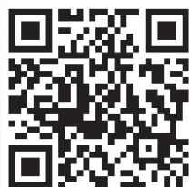
中正紀念堂粉絲頁

二、備取學員：備取學員請於 11月28日下午起 至本處網站或電話查詢是否遞補為正取，本處 不另行通知 ，逾期視為放棄。之後各階段遞補及繳費時間，請至本處報名網站查詢。