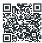
活化歷史 粉絲專頁